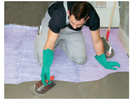
Die geeignete PCI Bodenausgleichsmasse wird auf der ausgelegten Glasfaserverstärkung PCI Armiermatte GFM ausgegossen und mit einer Spachtel verteilt (Mindestschichtdicke 5 mm).