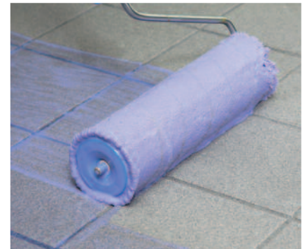
PCI Gisogrund 404 in der Kontrollfarbe violett ermöglicht eine hohe Verbundhaftfestigkeit von Ausgleichsmassen und Verlegewerkstoffen zum jeweiligen Untergrund.